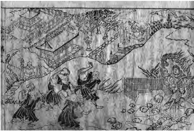
Libro japonés sobre leyendas budistas (c. 1680)

En la exposición, clausurada el pasado 8 de mayo, se exhibieron setenta y cinco piezas de procedencia oriental, japonesa, china, nepalí, tailandesa, mongola e india. Con ellas se logró reunir un sólido conjunto de libros xilográficos, grabados, tipos móviles de madera y de metal, tablas de maderas para imprimir, hojas sueltas,